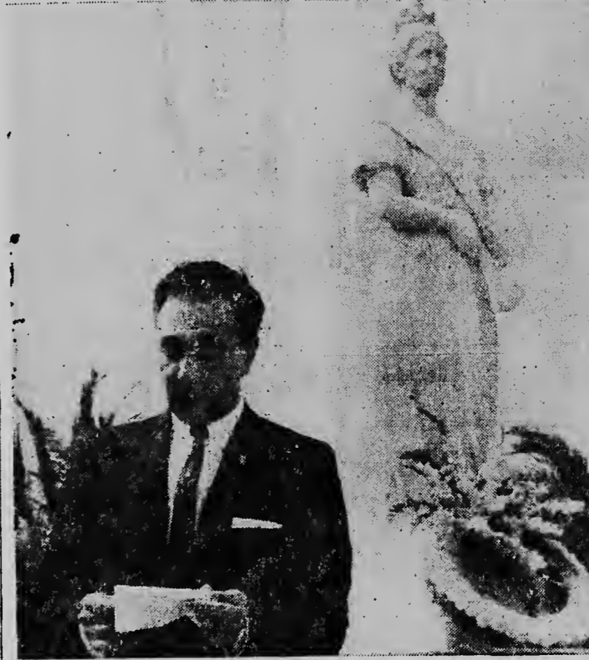
Gobernador di Lions sr. Arnold Cardarelli durante su discurso despues di e ponementu di crams cerca e monumento di Reina Wilhelmina.